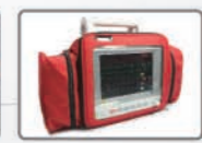
Sacoche de transport