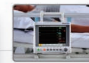
Crochet au lit