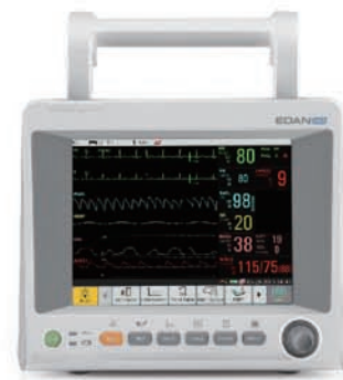
iM50 Moniteur de surveillance